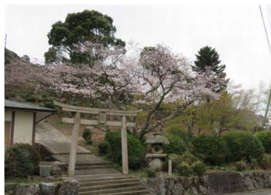
▲ H28 瀬戸公園の整備