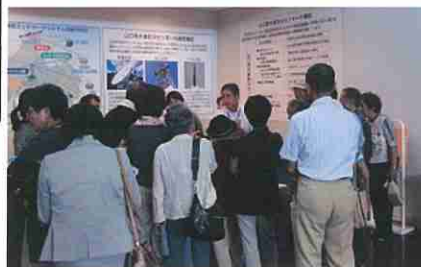
山口シニア地域マスターカレッジの皆さん