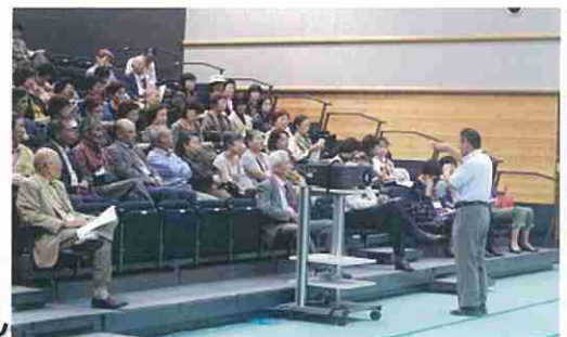
戸畑地区民生・児童委員の皆さん