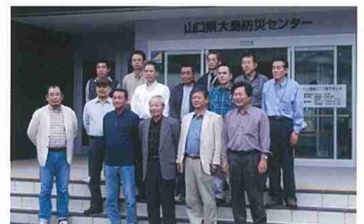
若松消防団幹部の皆さん