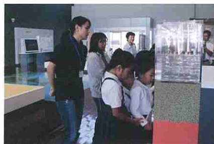
島中・浮島小学校の皆さん