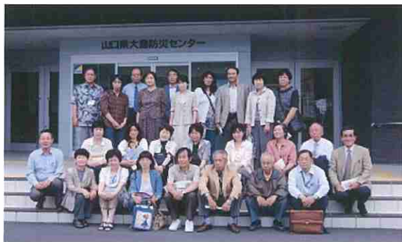
須々万地区民生委員児童委員会の皆さん

当センターは年末年始と月曜日以外は朝9時から夕方5時まで開館していますので、いつでもおいで下さい。職員に気軽に声をかけていただけましたら、いろいろと説明させていただきます。