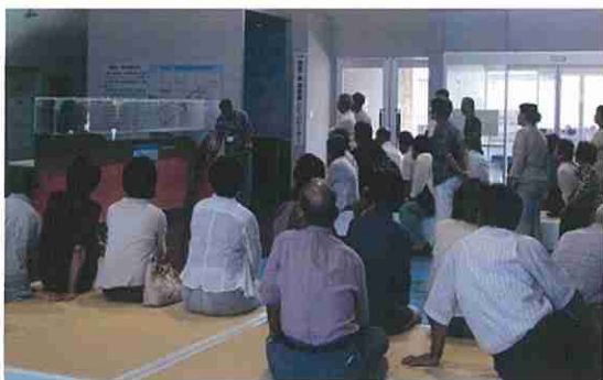
麻里布地区民生委員児童委員協議会の皆さん