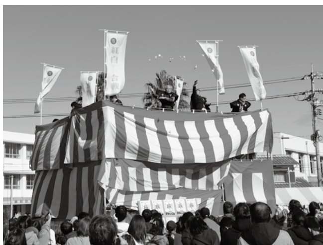
▲恒例の紅白餅合戦の様子

また、自衛隊、消防、警察の緊急車両乗車体験や、キッズ郵便局などのコーナーが設けられ、多くの方で賑わいました。