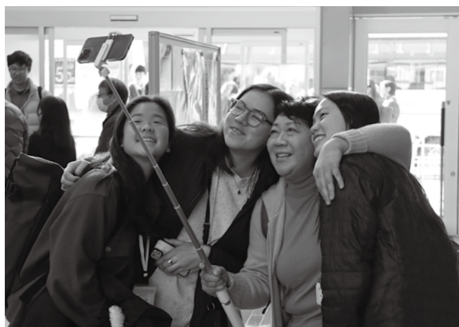
▲離村式（お別れの会）で交流を深めた民泊家庭の方と一緒に写真を撮る参加者

参加者は、餅つきや習字、神社やお寺への参拝など、日本の文化に触れながら、受入家庭や地域の方々との交流を深めました。