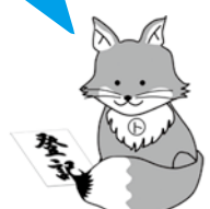
不動産登記推進イメージキャラクター「トウキツネ」