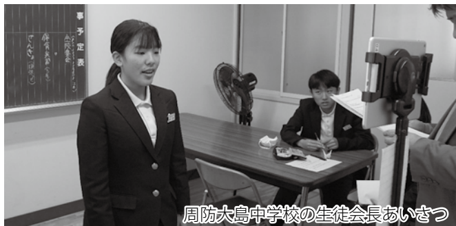
周防大島中学校の生徒会長あいさつ

大島中学校、周防大島中学校、周防大島高校の連携3校の代表生徒たちが、「総合的な学習（探究）の時間」等で取り組んだ学習・研究の成果について、ズームを使ったオンライン形式で各校に向けて発表しました。