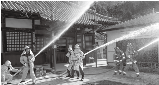
▲消防署および消防団による放水訓練の様子