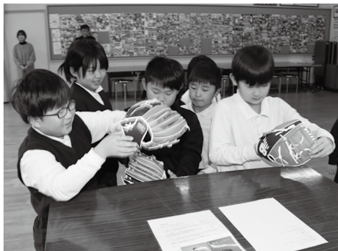
▲届いたグローブを手にする児童

グローブを受け取った児童たちからは、「ありがとう」「野球選手になりたい」などの声があがり、早速校庭に移動し、キャッチボールを楽しんでいました。