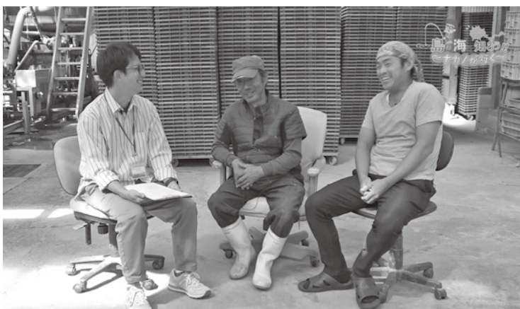
▲浮島の漁師さんいわし網漁などについてお話を聞きました

海を知ろう!!〜ナカノが行く〜第4回』では、いわし網漁をされている浮島の漁師さんにお話を伺いました。実際に漁へ同行させてもらいましたが、間近で見ると漁は迫力がすごく、網を上げた時に大量のいわしが見えた時はとても興奮しました。また加工場にもお邪魔させてもらい、いりこができるまでの過程を観ましたが、小学校の社会見学のように、とても楽しく撮影することができました。 番組はYouTubeの『周防大島チャンネル』で見ることが出来ますので、ぜひご覧ください。