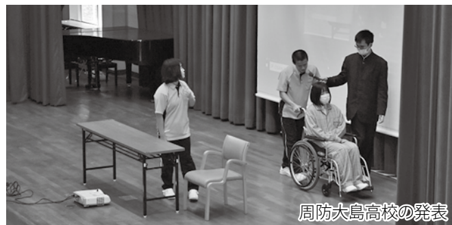
周防大島高校の発表