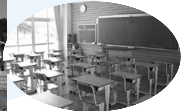
▲ 新しくなった教室