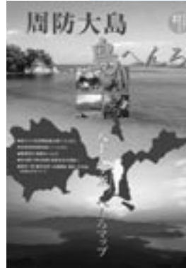
◀ ガイドブック「周防大島 島へんろ」