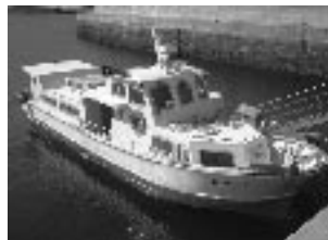
▲ひらい丸 (浮島航路)

政策企画課 地域振興班 ☎0820(74)1007 Eメール: seisakukikaku@town.suo-oshima.lg.jp