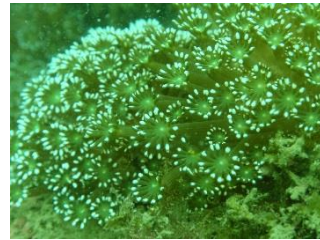
ニホンアワサンゴ