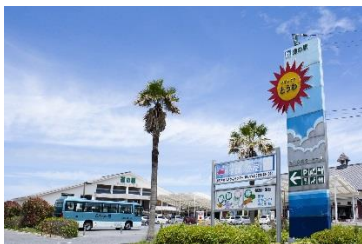
道の駅サザンセットとうわ