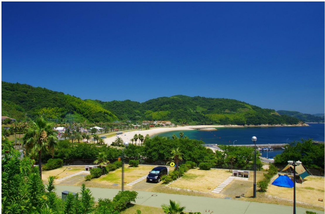
片添ヶ浜海浜公園