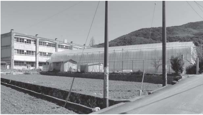
企業進出された旧三蒲小学校でパプリカのハウス栽培

問 廃校を活用したパプリカ栽培、IT企業によるサテライトオフィスの誘致に成功したが、今後の誘致計画について