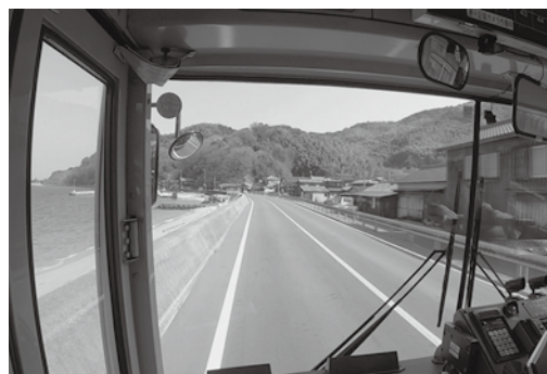
▲「島景色 防長バス 周防平野―周防油宇」は、周防大島チャンネルのユーチューブでも視聴できます。

なくなってしまう前になんらかの形で残しておくことの重要性を改めて感じました。周防大島出身の民俗学者・宮本常一氏の膨大な仕事の数々など、その最たるものかと思いますが、その時は当たり前にある風景・出来事などを何気なく記録しておくことが、後世の人にとってどれほどの財産になるのか、誰にとっても大きな時代の変わり目である今、実感させられた気がします。 今回廃止となった路線では4月1日からスクールバス混乗による代替運行が始まり、今まで通りバスを利用する方々と、学校に登下校する生徒たちが同じバスに乗り、同じ車窓からの景色を見ることになりました。そんな風の日々少しずつ変わっていく周防大島の風景を、皆さんそれぞれにできるやり方で残しておく、また覚えておいていただければ、と思います。