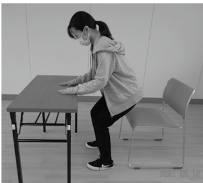
▲スクワットの様子

※回数やセット数は目安です。無理せず、自分のペースで行いましょう。また、持病のある方は主治医に相談しましょう。