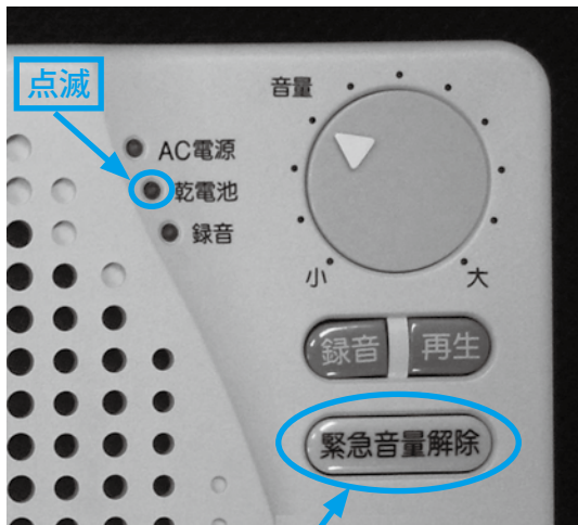
押すと一時的に音が止まります

「緊急音量解除」のボタンを押すと、一時的に警告音を止めることができます。放送を受信すると再び警告音が鳴ります。