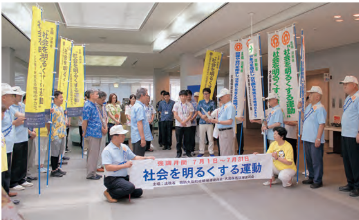
内閣総理大臣メッセージの伝達（大島庁舎）