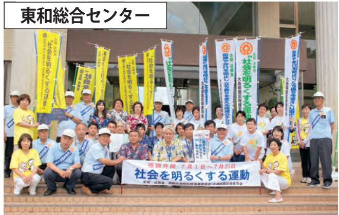
東和総合センター