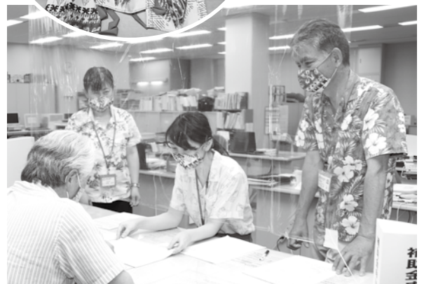
▲アロハとアロハ地のマスクで窓口対応を行う職員