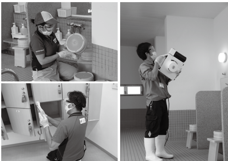
▲消毒作業の様子(グリーンステイながうら潮風呂保養館)

なお、新型コロナウイルス対策のため、一部施設の使用休止や営業時間の変更を行っている場合もありますので、利用する施設にご確認のうえご利用ください。