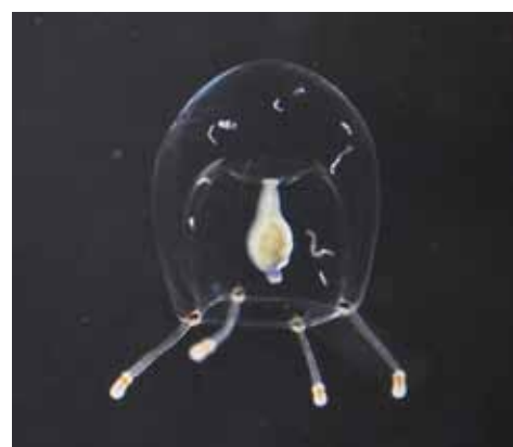
▲発見された「シトウズクラゲ」。傘の高さが7mmほどの小さなクラゲ。

発見したシトウズクラゲは、冬から春にかけてみられるクラゲで、なぎさ水族館では毎年採集し、名前がつけられる前から展示しています。