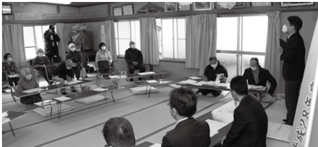
図政策企画課 広報情報統計班 ☎ 0820 (74) 1007