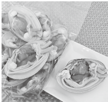
▲商品化したご当地冷凍シーフードの1つ冷凍スダレガイ

くても行けない、帰りたくても帰れない人たちにも周防大島の旬の海の幸をお届けできるようにと解凍しても品質の落ちにくい特殊冷凍機を使って、使いたい分だけロスなく解凍できる、産地の鮮度を閉じ込めたご家庭用のご当地冷凍シーフードを商品化しました。 大手メーカーさんのように大量生産はできませんので「売り切れ御免」の季節限定・数量限定となりますが、道の駅の物産品コーナーやオンラインマルシェ（通信販売）等で販売させていただきます。