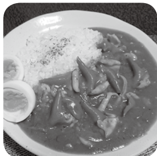
▲冷凍スダレガイを使用したシーフードカレー