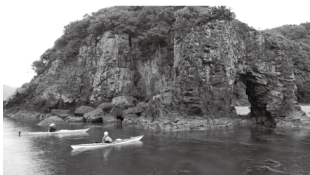
▲海側から見る「巖門」

初日(5/9)は強風に見舞われながら片添ヶ浜を出航しましたが、日向泊から山口県漁業協同組合東和町支店の伴走船に励まされながら無事に逗子ヶ浜へ到着できました。2日目(5/10)は逗子ヶ浜～真宮島～日前へ、3日目(5/11)は日前～久賀～三蒲へと順調に漕ぎ進みました。