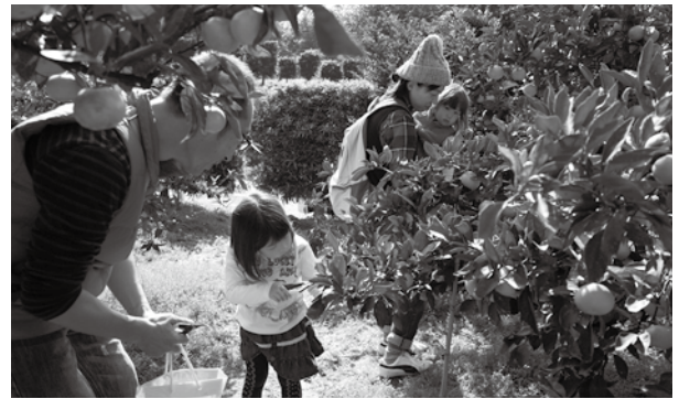
▲みかん狩りの様子

また、周防大島ならではのといえば食欲の秋の「みかん鍋」と、行楽の秋の「みかん狩り」も定番として外せません。近年ではみかん狩りに合わせてみかん鍋も10月1日に解禁することで「みかんの島」を盛り上げています。