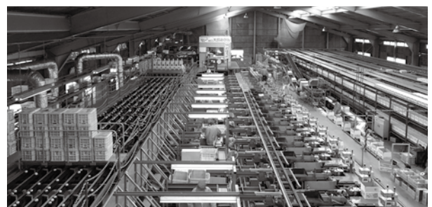
▲ JA 山口県周防大島統括本部柑橘選果場

特に柑橘選果場の作業工程は中々お目に掛かれないレア映像だと思いますし、みかんの島の底力を感じる迫力映像となりましたので是非とも放送をお楽しみください。