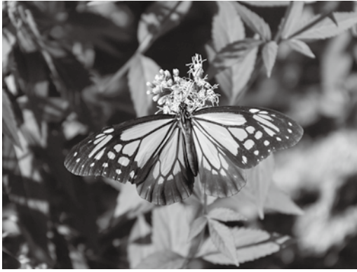
▲会で整備しているアサギマダラ園には、今年も多くのアサギマダラが飛来。

◆公益財団法人山口きらめき財団表彰 「県民活動きらめき賞」 花の咲く夕日の里づくりの会