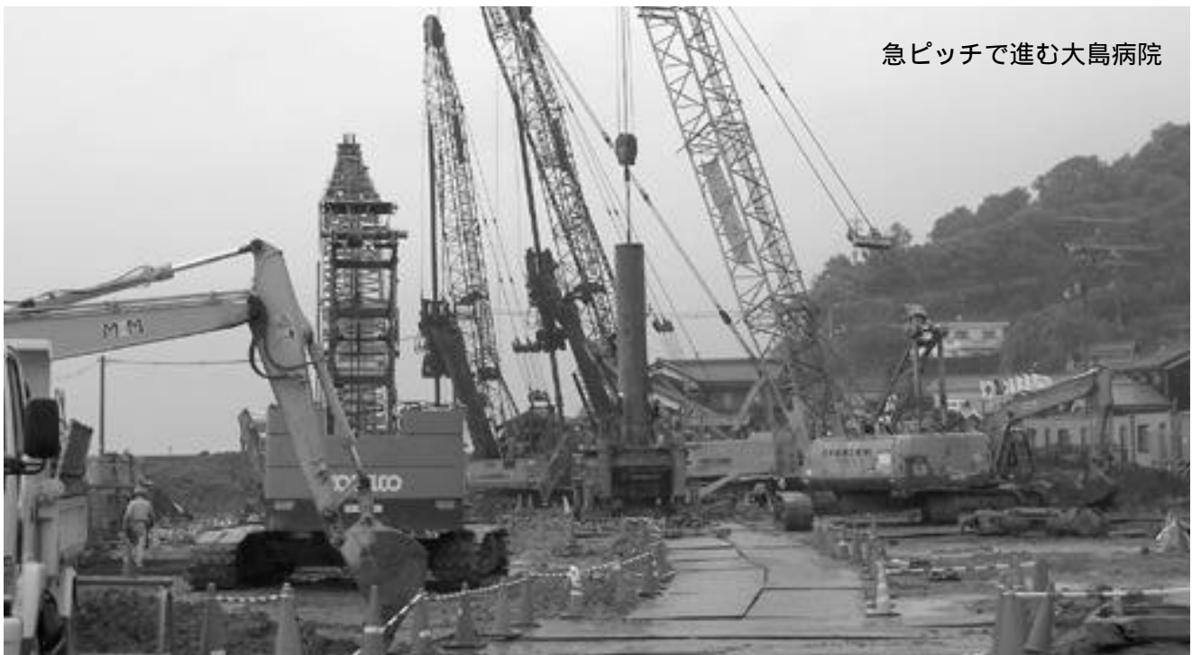
急ピッチで進む大島病院