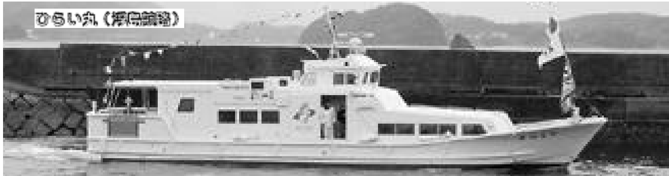
ひらい丸 (徳島錦崎)