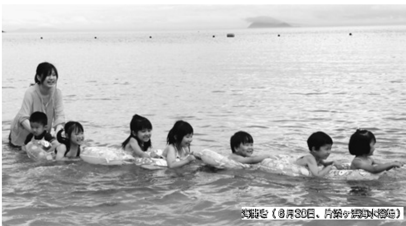
海遊び(8月30日、片瀬ヶ浜海水浴場)