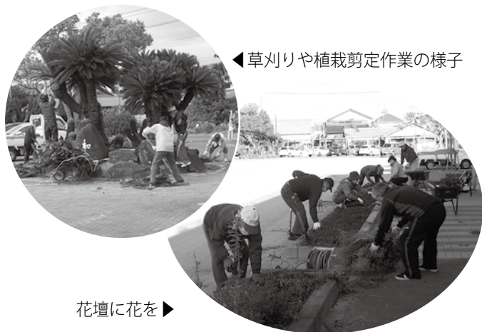
◀草刈りや植栽剪定作業の様子