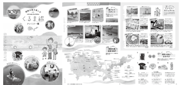
▲新しい試みとして、観光モデルコースを提案する「くるま旅」のパンフレット

これらのパンフレットをご希望の方は、周防大島観光協会までお気軽にご連絡ください。