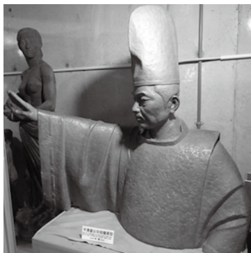
▶八幡生涯学習のむらに保管されている平清盛公日招像の原型

犬伏武彦ほか「長州大工が遺した社寺建築」、周防大島町文化振興会編「京仏師佐川定慶」、同編「彫刻家林健」の川口智氏の論考