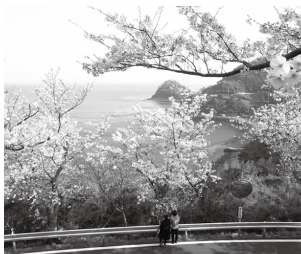
▲五条の千本桜(五条から望む景色)

所の桜を調査している力作です。この桜めぐりマップは、周防大島観光協会や道の駅サザンセットとうわなどで配布していますので、是非お手に取っていただき周防大島でのお花見にお役立てください。