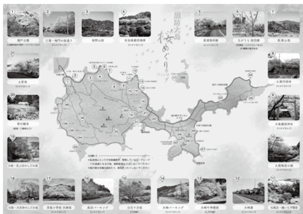
▲有志の方により作成された「周防大島桜めぐりマップ」

周防大島には河津桜から始まり山桜やソメイヨシノなど、瀬戸内海のブルーに淡いピンクが映える桜の名所がたくさんありますが、これら島の桜を多くの方々に知っていただければと、有志の方の編さんによる「周防大島桜めぐりマップ」がこのたび発行されます。