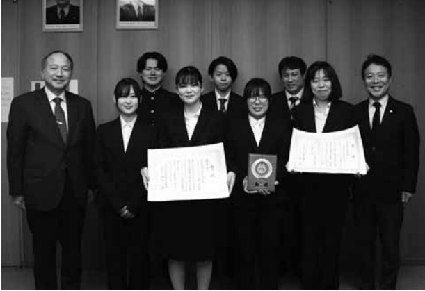
▲受賞の報告に訪れた大島商船高専チーム (Smart Searcher 開発 LAB) の皆さん

◆第1回高専 GIRLS SDGs × Technology Contest 優秀賞・高専 60 周年記念賞 Smart Searcher 開発 LAB (チーム名)