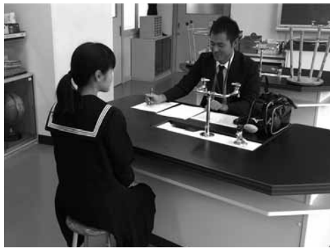
▲高校教員による中学生への進路相談の様子

高校教員に直接質問することで進路への不安を解消し、高校受験への前向きな気持ちを高めることができました。また、高校進学後の進路にも意識を向けさせることで、進路選択の重要性を伝え、進路実現のために今の学校生活や学習姿勢を見直すことの大切さを意識づけるよい機会となりました。