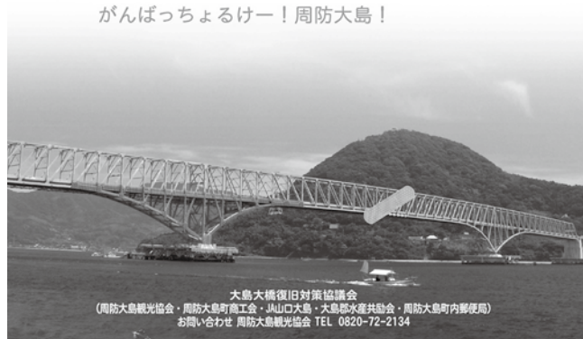
大島大橋復旧対策協議会 (周防大島観光協会・周防大島町農工会・J山口大島・大島郡水産共進会・周防大島町内郵便局) お問い合わせ 周防大島観光協会 TEL 0820-72-2134

元気いっぱい周防大島が戻ってきました！ 皆さまのご来島を心よりお待ちしております。 がんばっちょるけー！周防大島！」