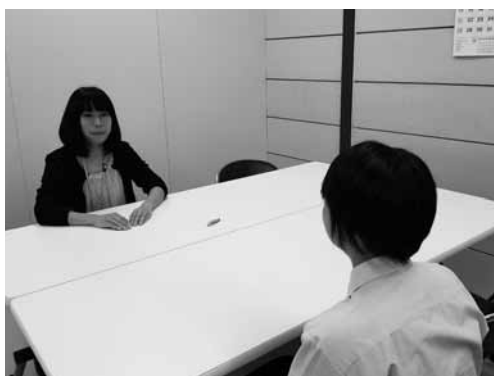
▲中学校養護教諭による高校1年生へのカウンセリングの様子

高校に入學して半年が経ち、学習面や学校生活での不安や悩みを中学校の先生に相談しました。生徒からは「高校でたくさん友達ができた話を話すと、中学校の先生も安心してくれた。」「今の中学校の様子や、自分の将来の夢について話ができて良かった。」「久々に話せて懐かしかった。」等の感想がありました。