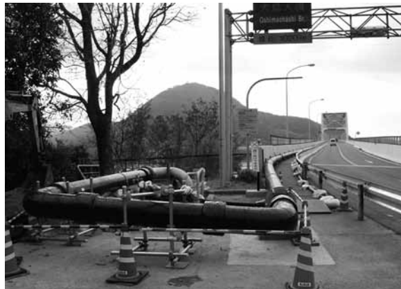
▲敷設された300mm 仮設送水管