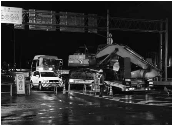
▲重車両による最終安全確認