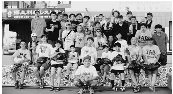
▲FAT CAMP（ファットキャンプ）に参加した皆さん

※地域おこし協力隊とは 都市地域の若者が地方自治体の募集に応じて委嘱を受け、一定期間地域に居住して地域ブランドや地場産品の開発・販売・PR等の地域おこしの支援や農林水産業への従事、住民の生活支援などの「地域協力活動」を行いながら、その地域への定住・定着を図る取組みです。隊員の活動に要する経費などは特別交付税措置されています。