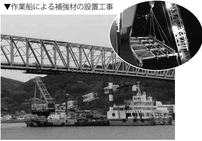
▼作業船による補強材の設置工事

大島大橋および送水管の本復旧については、いずれも平成31年4月末の予定となっております。