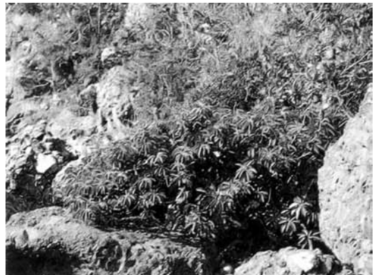
▲岩場に生息するアコウ

アコウは熱帯系のクワ科の植物で、南方の奄美、琉球方面に行くほど多くなる樹木です。南からの温かい海流が豊後水道を通過して入り、防予諸島を直撃します。周防大島町や柳井市平郡島・掛津島、上関町の島々などには熱帯系の植物が見られます。アコウはその代表的なもので、小水無瀬島、大水無瀬島で最初に、のちに祝島、掛津島で発見されました。小水無瀬島と大水無瀬島は昭和41年6月10日、山口県の天然記念物に指定されました。