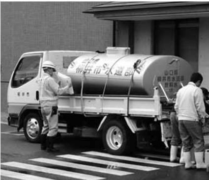
▲各市町からの給水協力