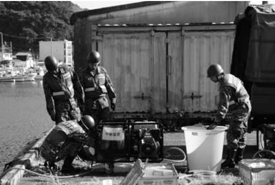
▲自衛隊の災害派遣（海水をろ過し、真水へ）