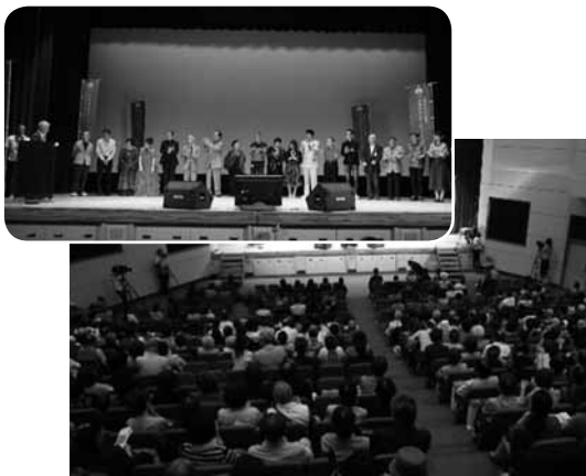
▶ 昨年のオーディションの決勝大会の様子