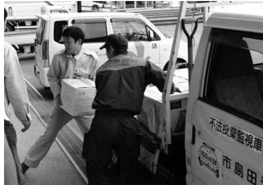
▲多くの方々からの飲料水の提供