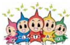
イメージキャラクター「エルレンジャー」

eLTAXは、地方税の手続きを、インターネットを利用して行うことができる便利なシステムです。