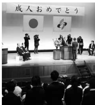
▲今年の成人式の様子