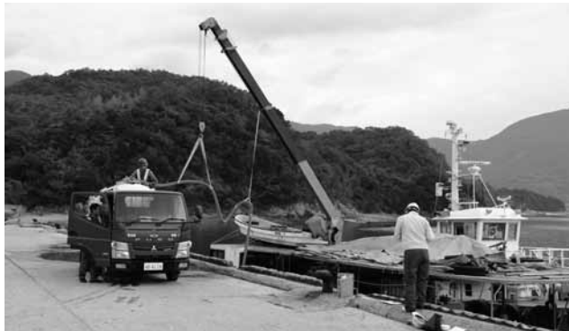
▲300トンの民間給水船の協力（給水車へ水を補充）

断水を受け、山口県内外の市町や企業・団体などから給水の支援や飲料水の支援、自衛隊の災害派遣、温浴施設の無料開放など、多くの暖かい支援をいただいております。