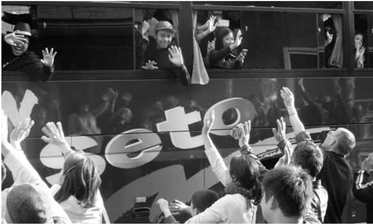
▲また会いましょう！

▶離村式で、一番印象に残ったことを話すラブスクール・クバヨランの生徒。「食べ物がおいしかった！」