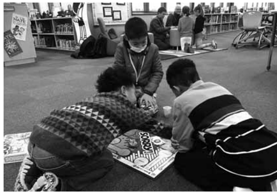
▲イングリッシュデイキャンプの様子

小中学校の児童生徒に基礎的・基本的な学習内容の定着を図り、学ぶ意欲や向上心を育むため、漢検・数検・英検の検定料を全額助成します。