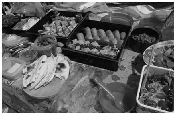
▲みんなが持ち寄った豪華なお花見弁当

き、島育ちの友人に教わりながらしばし山菜採りに熱中。その後はテニスブルゲーム、キャッチボール、フリスビーと気の向くままに、子供のよう遊んだお花見になりました。 都会の休日とは何かとお金がかかることが多く人混みに疲れますが、島の休日はお金をかけなくてもゆったり贅沢な時間が過ごせます。これから夏に向けて、どんな島の自然を享受できるのか楽しみです。 今回の海掃除は6月6日(水)午前10時から白鳥ヶ浜で行います。ご参加お待ちしております!