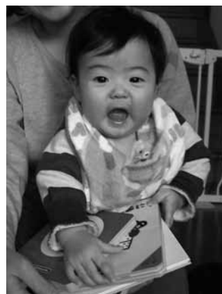
▲読み聞かせサポート事業

子どもたちが心豊かに育つことを願って、生後6カ月の乳児にファーストブック(絵本)を、保育所に絵本と紙芝居を贈呈します。