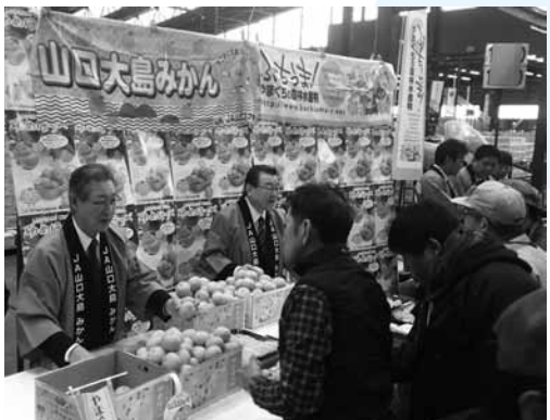
▶東京の大田市場でPR活動を行う椎木町長と吉村組合長