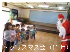
・クリスマス会(11月)