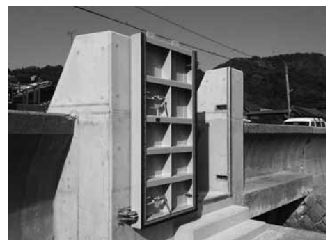
▲漁港陸閘整備事業（油宇）