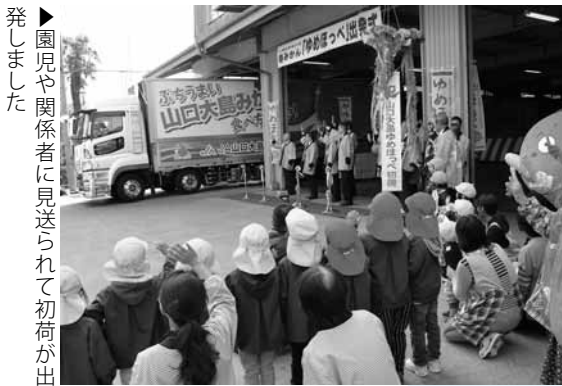
▶園児や関係者に見送られて初荷が出發しました