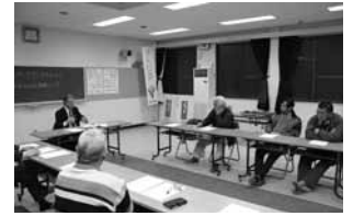
▲2月27日浮島地区での意見交換会の様子

町民の皆さんが積極的に町政運営に参画する仕組みとして、町長自らが町民の皆さんのところに出向き、自由な雰囲気の中でひざを交えて話し合いを行い、町民の「声」を聴く意見交換会「町長と意見交換会(ワンテーマディスカッション)」を実施しています。10月から3月までに開催された意見交換会は表のとおりです。