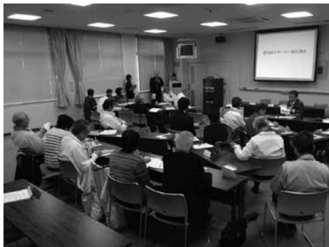
▲認知症についての研修を受講する 橘地区民生委員・児童委員

このことに由来し、毎年5月12日を「民生委員・児童委員の日」とし、その日から1週間を「活動強化週間」と定め活動を行っています。