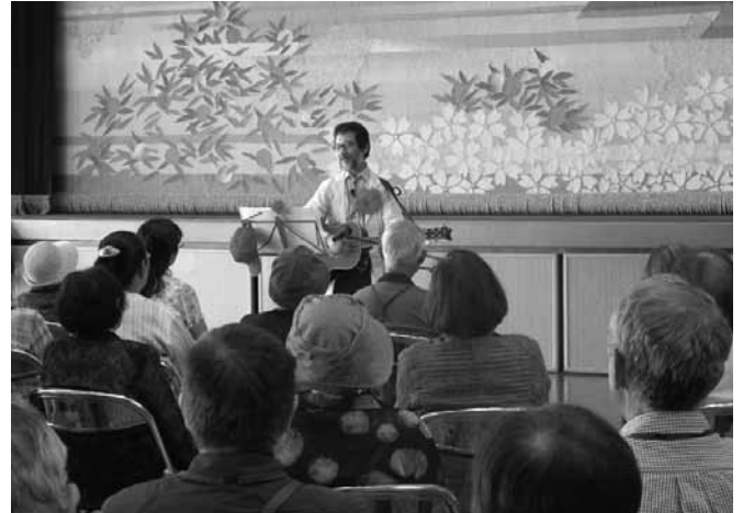
昨年度の生涯学習講座の様子

大島公民館 ☎ 74 - 3800 F A X 74 - 3999 oshimakoyoi@town.suo-oshima.lg.jp