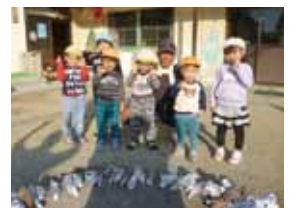
・地域の方の協力で焼き芋を食べました(11月)