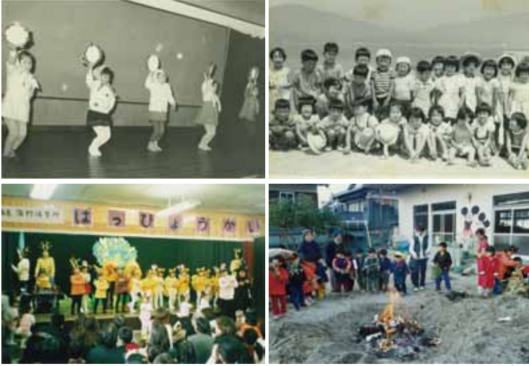
右上は三蒲の浜で記念撮影、左上はおゆうぎ会の写真とともに昭和40年代の写真。右下は平成14年のどんど焼き。左下は平成17年の発表会の様子。

僕は、兄弟弟の7人きょうだいです。みんな、蒲野保育所へ通っていました。閉所の事を聞いた時はビックリしたのと、さみしい気持ちになりました。蒲野保育所は、少人数でしたが地域の方や三蒲小学校との交流も多く、家族のような温かい保育所でした。小学生になっても、蒲野保育所との合同運動会など、色々な思い出が沢山あります。蒲野保育所が閉所になるのはとても残念ですが、保育所での沢山の思い出は僕の一生の宝物になると思います。