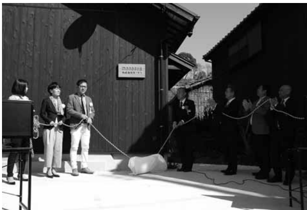
▲除幕式を行い開所を祝いました

話をして1日過ごすうちにすっかり地家室ファンになってしまいました。すぐそこにある海、プラネタリウムのよいうな星空、魚釣りから帰ってくるおじいちゃんの姿……。こちらでは当たり前の風景や近所の人との何気ないやりとりがこれから来る社員さんの仕事の疲れを心地よいものにするかもしれません。今後、働き方の選択肢が広がり、周防大島にこういったオフィスが増え、島の仲間が更に増えることを願います。 今回の海掃除は5月19日(土)午後4時30分から立岩海水浴場で行います。島々々々半島ツアーの参加者さんとおしゃべりしながらゴミ拾いしましょう。