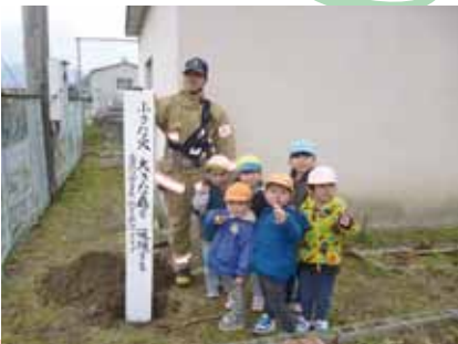
・防火杭を設置しました(3月)