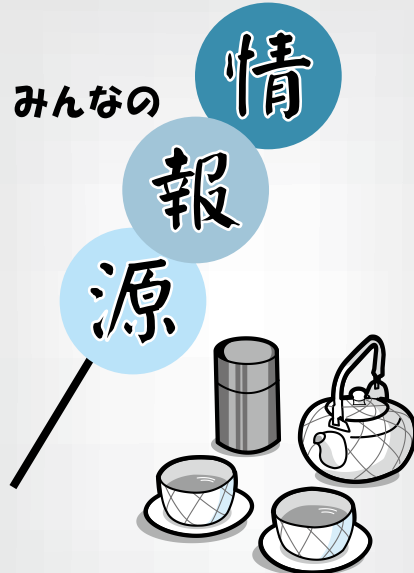
お知らせのコーナー