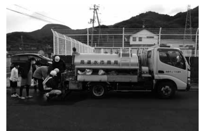
▲県内市町からの救援で開設された臨時給水所

このたびの断水により、臨時給水所で給水を受けようと多くの人がポリタンクなどの容器を買い求め、町内や近隣