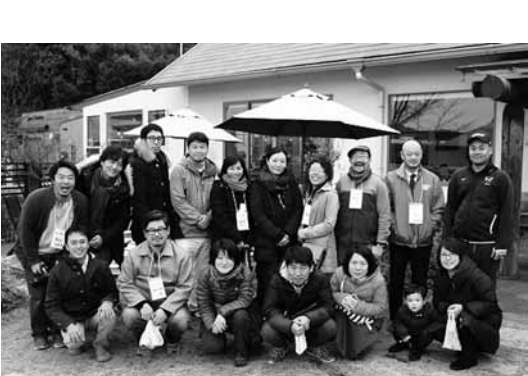
▲瀬戸内ジャムズガーデンで記念撮影

年に3回、定住促進協議会で開催している「島時々半島ツアー」がこの1月に16回目、5周年を迎えました。周防大島に移住を検討している方が参加するこのツアー。参加希望者には参加申し込みの段階から「おもてなしは致しません」とお伝えしています。移住した後の生活をリアルに描くことができるよう、島暮らしのメリットだけでなくデメリットも隠さずにお伝えしよう、島暮らしのメリットだけではないのです。例えば、島の医療のお話をお医者さんに聞いたり、島生活に向けたマネーセミナーや海掃除、みかん鍋を囲みながら移住の先輩や地元の方々との交流をしたりと、個人で周防大島へ来られてもなかなか経験できないような濃い内容となっています。