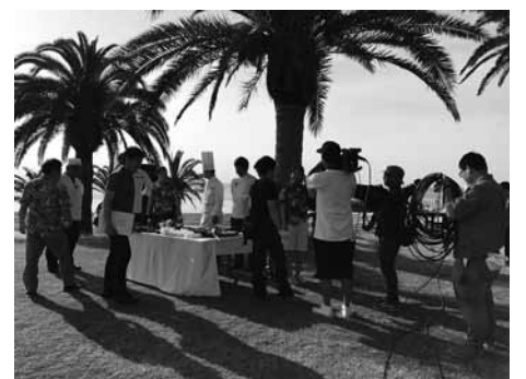
▲全国ネットの生中継の準備を進める撮影班や出演者の皆さん

近年では「みかん鍋」や「サタデーフラ」が話題となり、テレビや雑誌など年間100本近い取材に対応いたしますが、出演機会の多い料理人さんやフラダンサーの皆さんは、今やプロ顔負けの演出でご活躍いただいています。