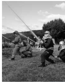
消防団と消防署による放水訓練④と地域住民によるバケツリレーの様子⑤

国指定の重要文化財「木造阿弥陀如来坐像」のある日見の西長寺で1月26日、消防訓練が行われました。訓練には地域住民をはじめ消防署員、消防団員ら約80人が訓練に参加。被害を最小限に留めるためのバケツリレーや初期消火訓練などに真剣に取り組みました。