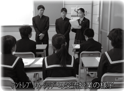
アントレプレナーシップの交流授業の様子

今後も引き続き、中高一貫教育の特性を活かし、中学生と高校生が一緒に学べる機会を増やしていきたいと考えています。