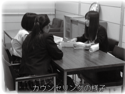
カウンセリングの様子