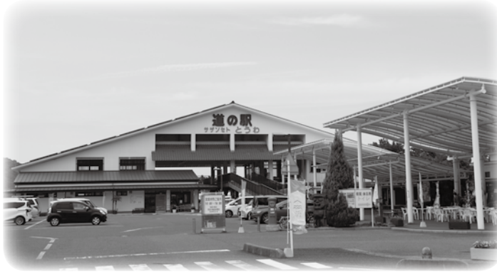
▲道の駅サザンセットとうわ