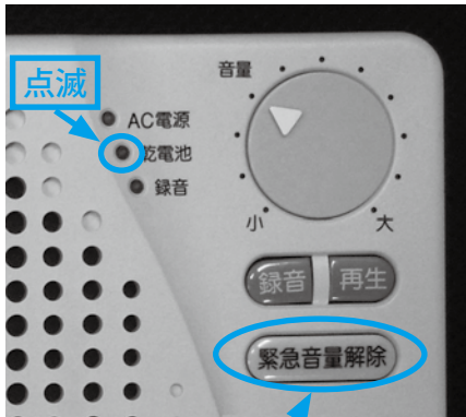
押すと一時的に音が止まります

「緊急音量解除」のボタンを押すと、一時的に警告音を止めることができます。放送を受信すると再び警告音が鳴ります。