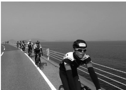
▲サイクリングイベント「シマクル」。潮風を受けながら、周防大島の景色を満喫。

大師堂めぐり歩け歩け大会」は、あいにくの雨天となりましたが、それでも400名を超える皆さまに参加していただき、今年30回目という歴史あるイベントに関われたことを嬉しく思います。 さらに、今年初となるサイクルイベント「シマクル」では、実行委員として携わりました。県内外から100名を超えるサイクリストの方の参加があり、風光明媚な周防大島の景観を楽しんでいただきました。今後も年次イベントとして全国のサイクリストが参加したいと思っています。 スポーツ・アウトドアイベントの企画運営が2年目となる本年度は、協力隊としての使命感をもってさらに進めていき、周防大島の魅力を広める役割の一端を担えるよう頑張っていきます。