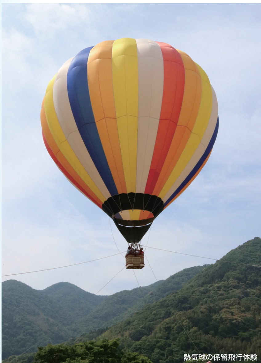
熱気球の係留飛行体験

5月26日、屋代ダム公園で、自然の中でさまざまな遊びを楽しむ野外フェスティバル「PLAY FES」が開催されました。周防大島で初となる熱気球の係留飛行体験や自然の中で楽しめるアクティビティ、また、バーベキューやフラダンスのワークショップ、ステージイベントなどが行われました。