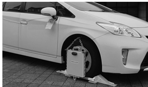
▲自動車などを差し押さえ、タイヤロックを実施する場合があります。

⑤公売・換価充当・・・差し押さえた財産は公売（売却）等により換価（現金化）し、滞納金に充当します。