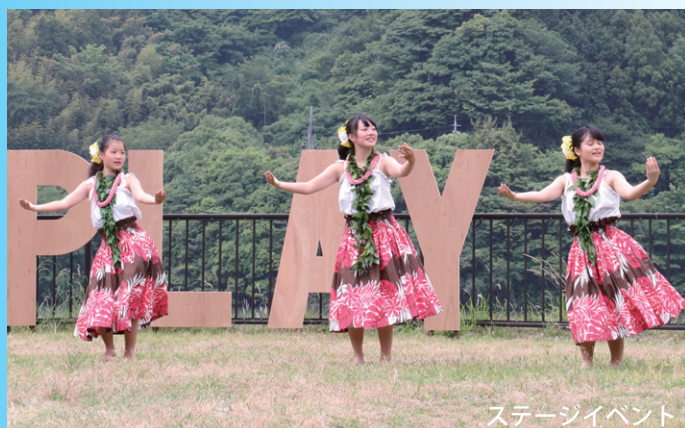
ステージイベント