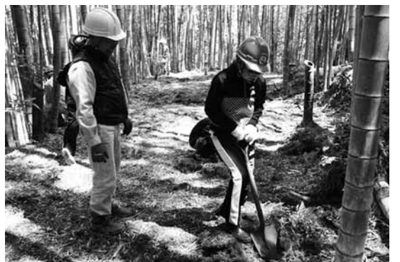
▶いぎ、タケノコ収穫！

4月15日、三浦小の1・2年生6名と明新小5年生16名が西三浦の竹林でタケノコ掘りを行いました。