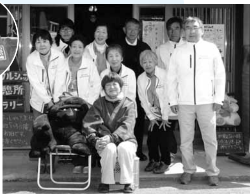
▶「いろいろ庵」を運営する橋地区協議会の皆さん