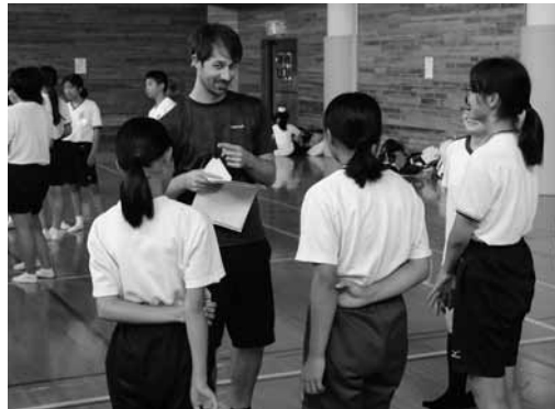
▲イングリッシュキャンプの様子

町内の中学生および高校生を対象としたイングリッシュキャンプに加え、小学生を対象としたイングリッシュデイキャンプも実施します。また、小学校の低学年と中学年を対象とした英会話学習等を実施します。