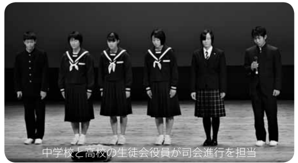
中学校と高校の生徒会役員が司会進行を担当

各校の工夫を凝らした発表をお互いに見聞することにより「郷土おおしま」についての知識や理解を深めるとともに、ふるさとに対する誇りと愛着を育むよい機会となりました。