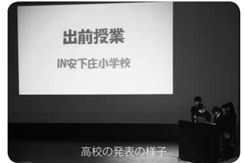
高校の発表の様子