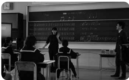
▲音楽の研究授業の様子

中高一貫教育では、中高の教員が相互に訪問し、複数の教員できめ細かな学習指導を行う「交流授業」を行っています。12月には、安下庄中学校と久賀中学校で、中高教員のチーム・ティーチングによる音楽の研究授業が実施されました。今年度は創作をテーマにリズム合奏や映像音楽づくりなど、チーム・ティーチングだからこそできる授業を展開しました。