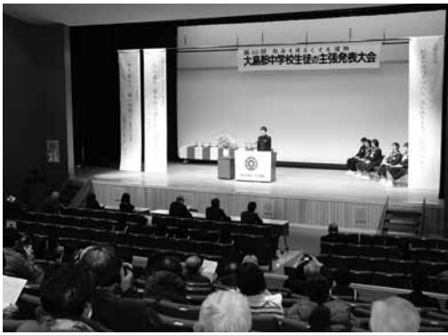
▲大島郡中学校生徒の主張発表大会の表彰式の様子 (1月16日)