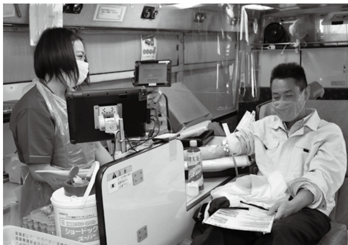
▲看護師さんと話しながら和やかな雰囲気です