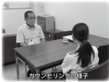
カウンセリングの様子