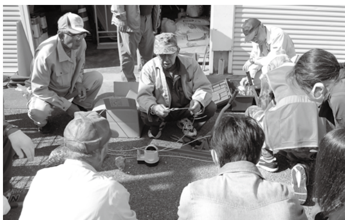
▲罾くくりわなの作成方法について、講師の説明を真剣に聞く受講者の皆さん