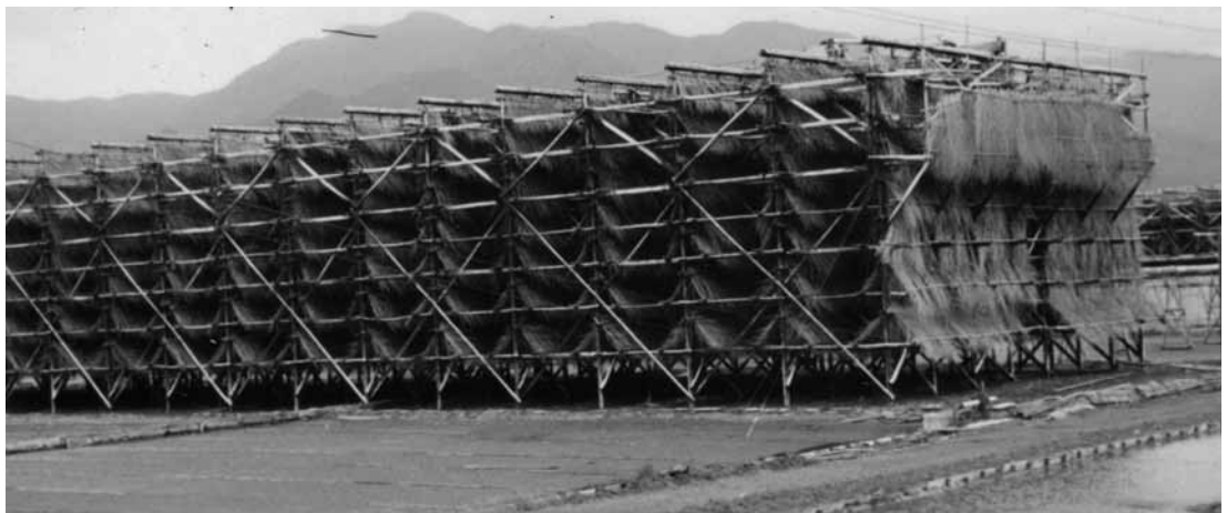
▶流下式塩田の枝条架装置