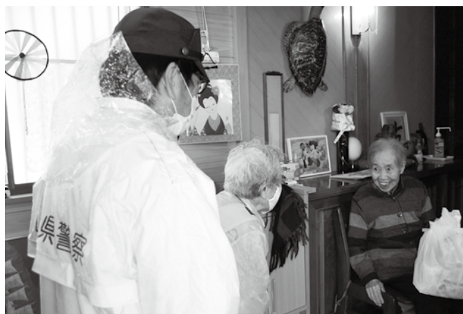
▲交通安全と防犯の呼びかけを行う関係者の皆さん