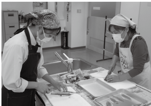
▶アジの3枚おろし講習の様子

活動は限られますが、感染予防の対策を十分にして、地域の方に食の大切さや楽しさを広めていきたいと思えます。