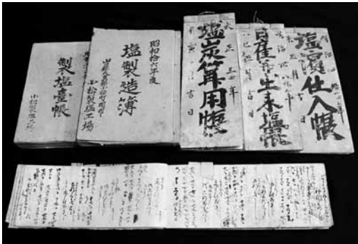
▲小松塩田関係文書

さて、町教育委員会が保管する塩田関係文書類は明治時代から小松塩田が廃業するまでの期間に記されたもので、「算用帳」や「製塩台帳」「日雇帳」をはじめとする100点余からなる。塩の出荷量や価格、また塩を生産するために塩田で用いられた石炭の量や労働者の人数や給金などがわかる。その他、大正時代の塩釜神社の例祭における寄付者一覧などもあり、小松塩田を中心にした小松・開作地区の繁栄をうかがうことができる。