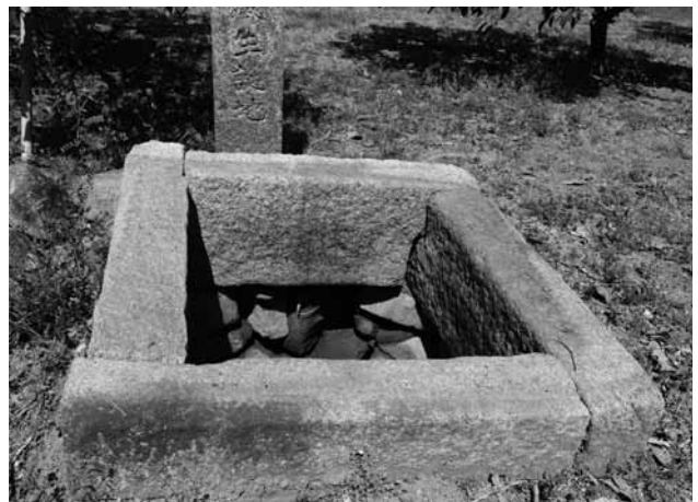
▲唯一残る井戸が二人が暮らした時代を伝えている

令和元年度で周防大島町内にある指定文化財38件の紹介は終了しました。しかし、未指定ながらも魅力的な文化財が町内にはまだまだたくさんあります。そこで本年度からはそれらの大切な文化財を町民の皆さんと共有したいと思い、引き続き連載してまいります。