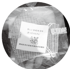
▲子ども達へのメッセージとともに1つ1つ包装された手作りマスク