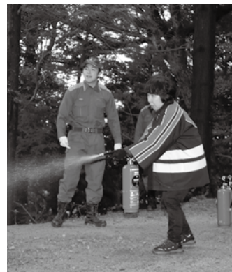
▲消火器の取り扱い講習

1月24日、文化財防火デーの一環として、県指定有形文化財「木造二天王立像」が安置されている、三浦の松尾寺で消防訓練が行われました。