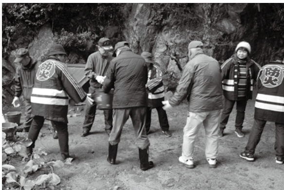
▲バケツリレーによる初期消火訓練