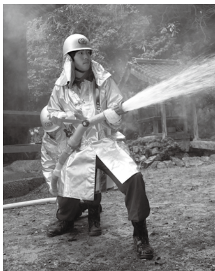
▲消防団員による放水訓練の様子