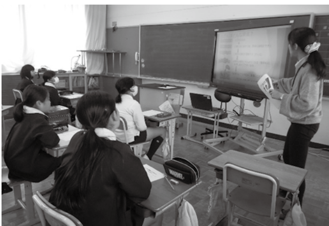
▲「がん」についての授業を真剣に聞く児童の皆さん

生活習慣とかかわりの深い「がん」。周防大島町が推進している「ちよび塩」もがん予防につながります。授業の中で実際に塩1gの量を予想したり、1日に摂ってもよい食塩量を確認したりしたことが、自分の食生活を見直すきっかけにもなったようでした。