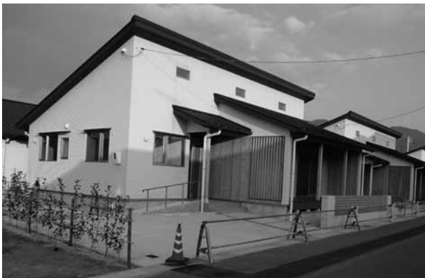
※写真および間取図はBタイプです。