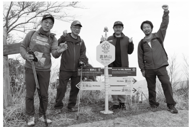
▲周防大島チャンネル「シマタビ」での登山の様子

また下山後には、名物みかん鍋や温浴施設等も合わせてお楽しみいただき、疲れた体をリフレッシュなさってください。