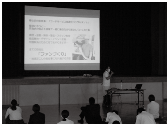
▲周防大島高校で行った講演の様子

今年周防大島高校にて、学生の皆さんの前で関東からの移住者として、地域おこし協力隊として、私の視点で周防大島の魅力をどう捉えているのかを講演させて頂く機会を頂き、主に「海岸線の外側」のお話をしました。 世界と繋がる情報通信網の中で育った若い世代の皆さんですから海の先にある対岸地域、そして世界を自然と視野に捉えてくれるのは頼もしいところです。 夏前にスタートした、「地域の魅力発掘」の kari キュラムはそろそろ「実りの秋」を迎えている頃です。未来の担い手である若い皆さんの成長が楽しみでもあり、同時に、私もまだまだ負けていけないという、良い刺激でもあります。