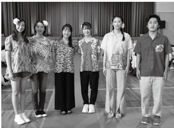
▲自分で作成したアロハシャツを着てファッションショーのモデルを務めた周防大島高校の生徒の皆さん