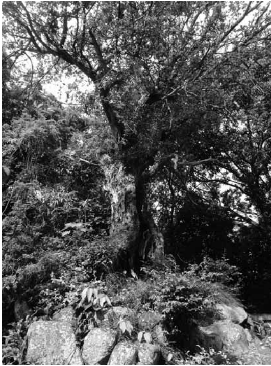
▲長尾八幡宮の社叢にあるウバメガシ

石段を登って境内を10メートルほど進むと、北側の下斜面に20メートルを超える大きなホルトノキが立っています。ホルトノキはオリーブと混同されることがあります。諸説ありますが、この木の実がオリーブの実に似ていることから、見間違えられてホルトノキとされたといえます。昔は食用にもなっていたようですが、浮島では「くいもの木」といいました。