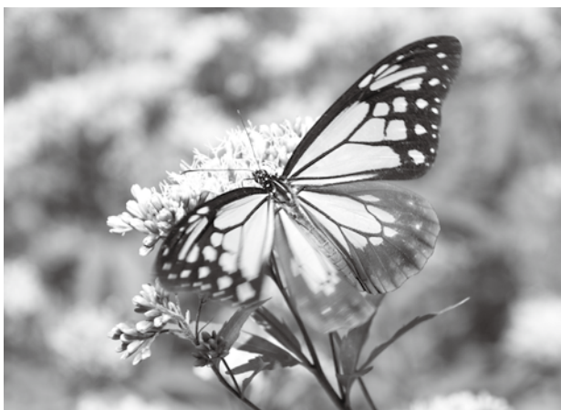
▲フジバカマの蜜を吸うアサギマダラ