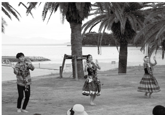
▲瀬戸内海をバックに芝生のステージでフラを披露する参加チーム

サタフラは、9月25日までの毎週土曜日、道の駅サザンセット東和、竜崎温泉、グリーンステイながうら、H&Rサンシャインサザンセットで開催される予定となっていますが、天候や新型コロナウイルス感染症の影響によっては中止になる場合があります。