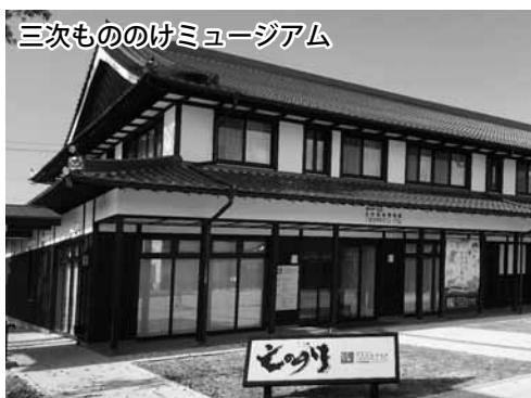
三次もののけミュージアム

今高野山龍華寺(紅葉観賞)、道の駅世羅(ショッピング)、東酒屋エリア散策(広島三次ワイナリー(昼食・奥田元宋・小由女美術館・トレッタ三次)、三次もののけミュージアム