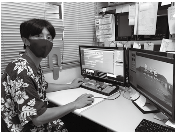
▲周防大島チャンネルの番組は放送後、YouTubeでも視聴可能です

制作した番組をいくつか振り返ってみると、私自身が子育て真っ最中ということもあり、大島の育児の状況や疑問などを番組にした「しまっこつうしんすくすくおおしま」、現在も猛威を振るう新型コロナウイルスの感染が拡大した昨年春には、人に会わなくても制作可能な番組を…ということで大島の各集落の美しい風景を撮影する「島景色」周防大島の風景を巡る「も開始。また私事ですが、2020年には柑橘農家とし