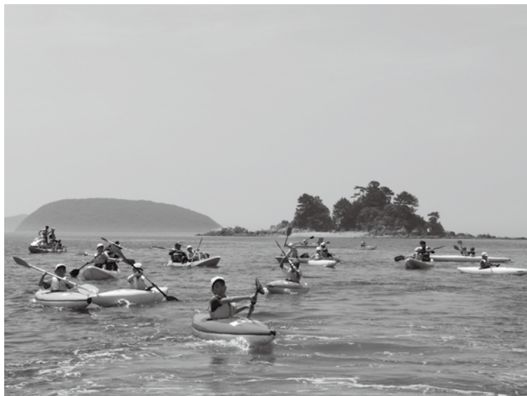
▲艇庫～彦島間を往復する児童