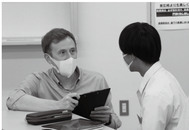
▲ALTと英語のみでやり取りをする参加した生徒