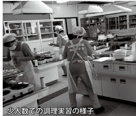
少人数での調理実習の様子

部での研修会（調理実習も班に分かれて少人数で実施）や自己学習と、できることから活動しています。推進員で試作を繰り返しながら減塩献立を作成したり、減塩のおかずをお弁当の形にして皆さんにお配りし、「減塩でもおいしい」を体験してもらったり、今だからこそできることを探索中です。