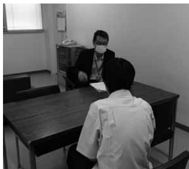
▲中高一貫カウンセリングの様子

生徒たちは久しぶりに恩師に会うことができ、「懐かしい」と喜んでいました。また、カウンセリング後は「先生に課題を頂いたので頑張ります」「久しぶりに話ができ安心した」「悩み事を聞いていただいて気持ちが楽になった」等の感想がありました。 面談後の生徒たちの表情はみな明るい様子でした。信頼する先生とのカウンセリングによって生徒たちの気持ちも心機一転。これからの充実した高校生活に向けて良いきっかけになったと思います。