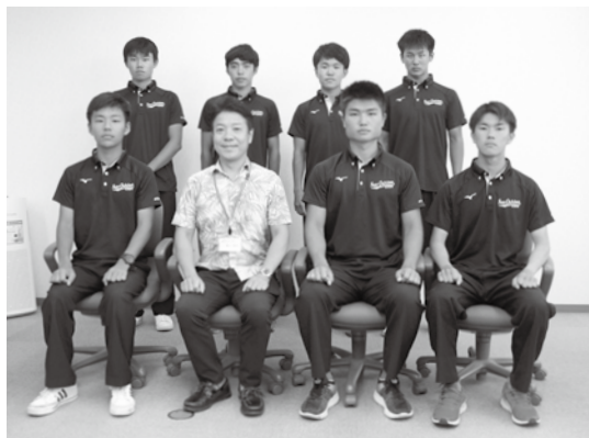
▲激励費授与式に出席した周防大島高校ボート部の皆さん(7月30日)