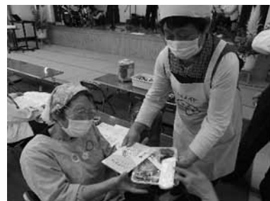
▲食推で作ったお弁当を脳トレドリルとともにサロン利用者に配付

以前のように調理実習をしたり、大勢で食事を囲めるようになったりするのを楽しみに、今はレシピの配布などできる活動に取り組んでいます。