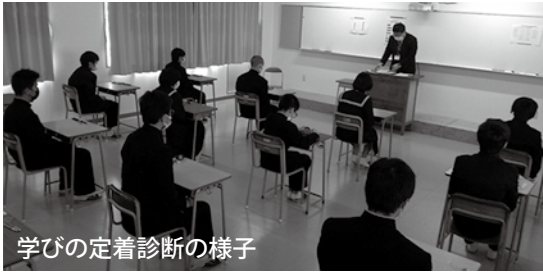
学びの定着診断の様子

普段とは異なる会場で、他校の生徒と試験を受けることで、学校で行われている定期考査とは違った緊張感の中で学力診断テストを受けることができました。中学三年生にとっては、高校入試に向けて学習の到達度を確認する良い機会となりました。