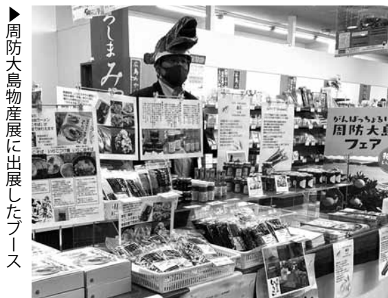
▶周防大島物産展に出展したブース

などの準備を半月ほどかけて徹底し、結果として売上高以上に価値ある検証ができました。 例年、商品Aと商品Bを並べると必ずAの販売数が勝っていたものが、料理のレシピ紹介パネルの前に並べるとBの販売数が大差をつけて逆転するなど、「情報」という付加価値で購買傾向を変えられる例を実績としてつくることができました。 これは「お取り寄せ」インターネット販売などで非常に重要となる手法です。 人の物理的な往来が制限される社会で地域経済活性化を考えるには、当然のことながら戦略的な「情報発信」が不可欠であることを実感します。