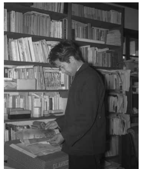
書架で本を手にする宮本常一 (1907-81)