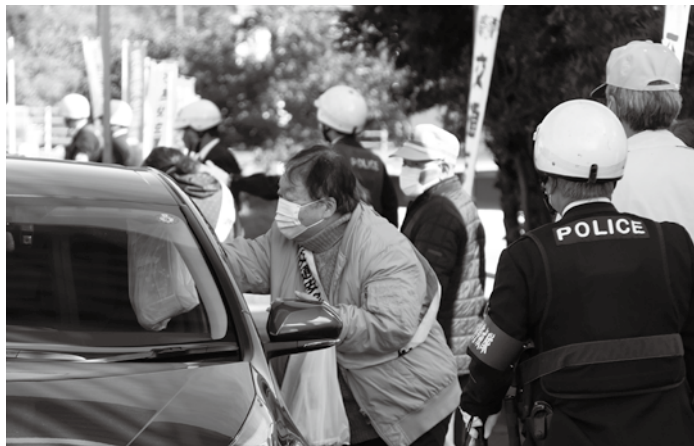
▲ドライバーに交通安全を呼びかける関係者の皆さん