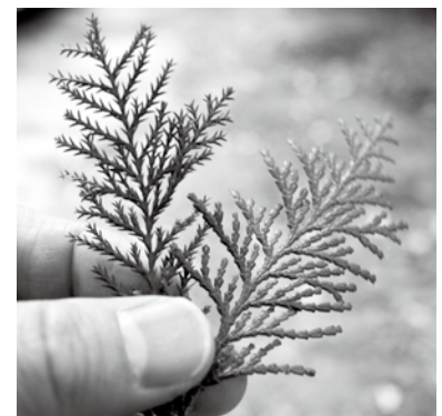
▲サワラ④とヒノキ⑤のりん葉

サワラはヒノキ科で日本固有種。日本語の漢名は榧。材は軽く、やわらかで割れやすいなど材質が劣ると考えられ、中国地方以南では植林を見ていない。園芸品種のヒヨクヒバ、シノビヒバ、ヒムロなどは神社、寺院、個人の庭などによく植えられている。