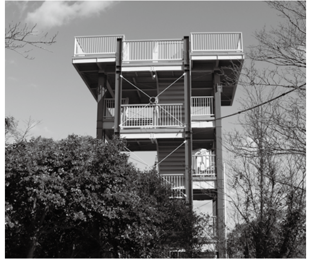
▲改修された飯の山頂上の展望台

展望台屋上に設置してある風景パネルも新しくなりましたので、そこから見える素晴らしい眺めと見比べてみるのも面白いかもしれません。ぜひ一度、きれいになった飯の山展望台に足を運んでみてください。