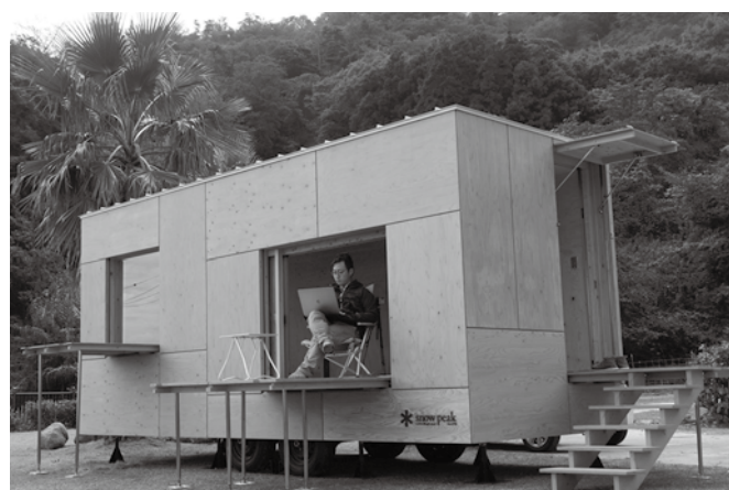
▲片添ヶ浜オートキャンプ場にアウトドアオフィスとしての活用を目的に設置された「住箱」