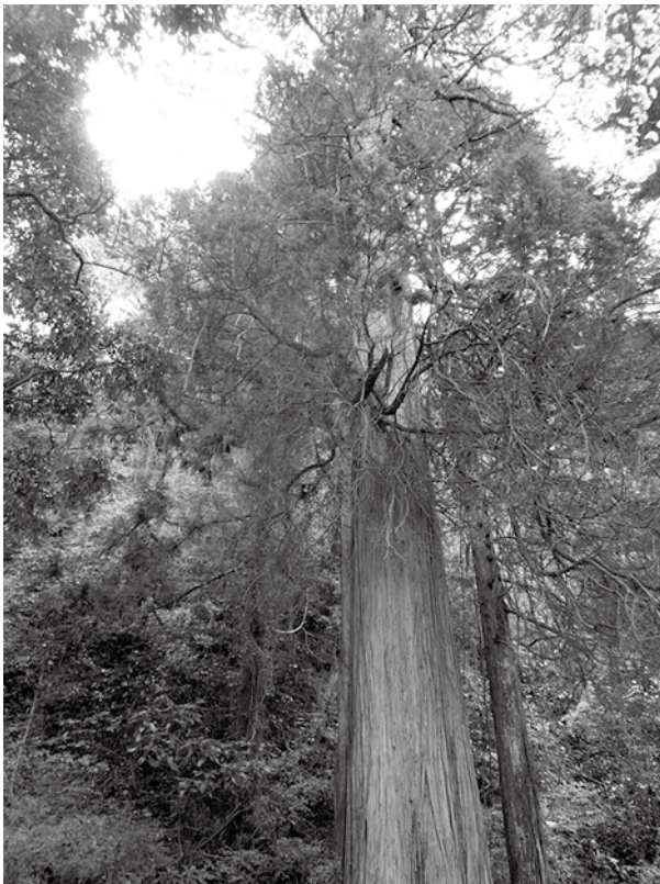
▲文珠堂のサワラは山口県下で最大級

①地上高さ1.5mの目通り幹 ②根回り約4m、③ ④地上高さ約30m、⑤ 樹姿はほぼ直立。厳密には南東に約5度傾き、やや細長く伸びている。(測定日:令和2年12月3日)