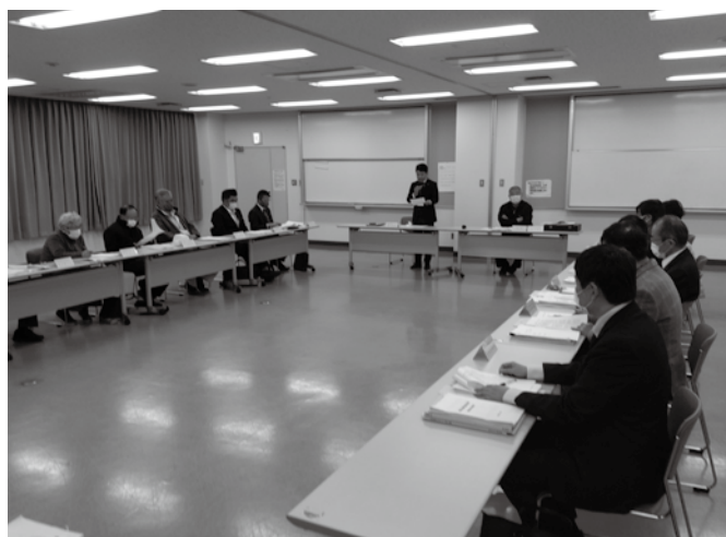
▲第3回目となる総合計画策定審議会の様子

今回の会議では、基本構想と前期基本計画の素案について意見が交わされ、防災対策や福祉、教育、地域コミュニティをはじめ感染症に関する事など幅広い分野にわたり熱心に議論いただきました。