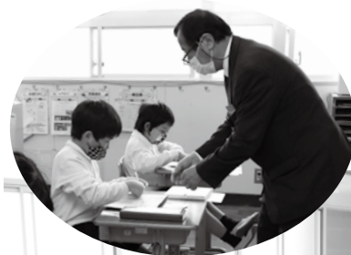
◀手紙の書き方教室の様子

贈呈式後は、手紙の書き方教室が行われ、手紙を書いてから届くまでの流れや年賀状の書き方などを学びました。子ども達は早速、おじいちゃんやおばあちゃんなどに宛てて、新年の目標などを年賀ハガキに書き込んでいました。