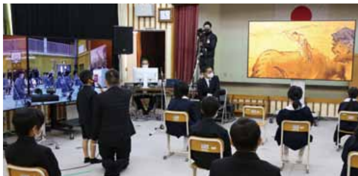
▲高細密な画像でモニターに映し出される雪舟の絵について、気づきや考えを発表する沖浦小学校の児童。