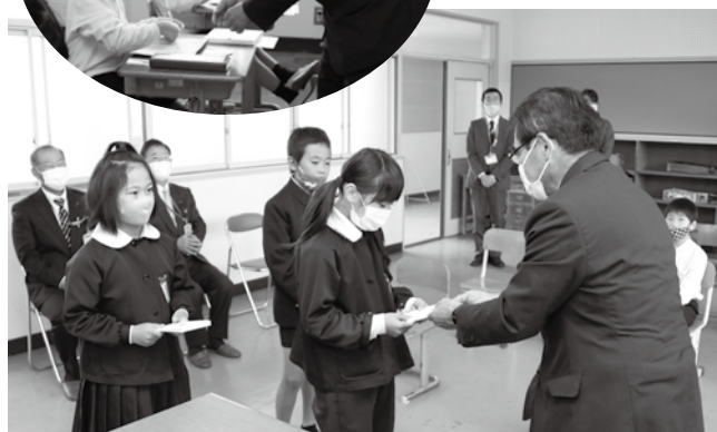
▲島中小学校で行われた年賀ハガキ贈呈式