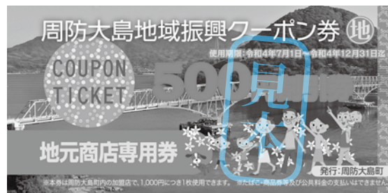
【地元商店専用券 見本】