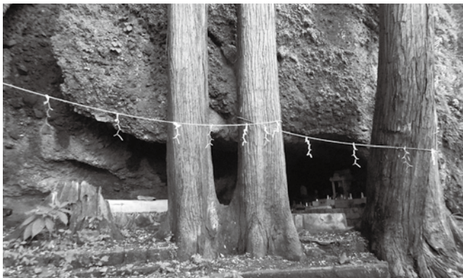
▲高山中腹にある岩屋権現

岩屋権現は高山の中腹、大字東安下庄にある。高山頂へ向かう県道沿いに駐車場があり、そこから鳥居をくぐり400メートルほど歩くと大きな杉の木に囲まれた岩窟が目に入る。そこが岩屋権現である。往時、帶石山普門寺は天台宗で、この場所に守護神として山王権現を祀ったのが始まりという。その後普門寺が真言宗となり虚空蔵菩薩を祀った。天保13年（1842）に成立した『防長風土注進案』には、帶石山普門寺の項に「奥之院嶽ノ窟本尊 虚空蔵 木佛立像長ケ一尺八寸」とある。天保15年（1844）、山王権現は長尾八幡宮に合祀された。現在の主神は国常立命である。明治34年（1901）通夜堂が東安下庄の塩宇地区に建てられている。岩窟の正面の石段から下っていくと通夜堂にたどり着くが、現在は通行が困難である。岩窟で火をおこし、この火で餅を焼いて食べると、その年は無病息災といわれ、正月三日には老若男女で賑わい無病息災を祈る。この火の管理は塩宇地区の人々が行っている。近年は岩屋のほか、帶石（千手観音）、立岩（馬頭観音）、巖門（十一面観音）とあわせて四ヶ所巡る「しあわせ祈岩」（四岩合わせ奇岩）の参詣者も増えている。