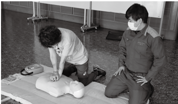
▲消防隊員から指導を受けながら心臓マッサージを行う参加者