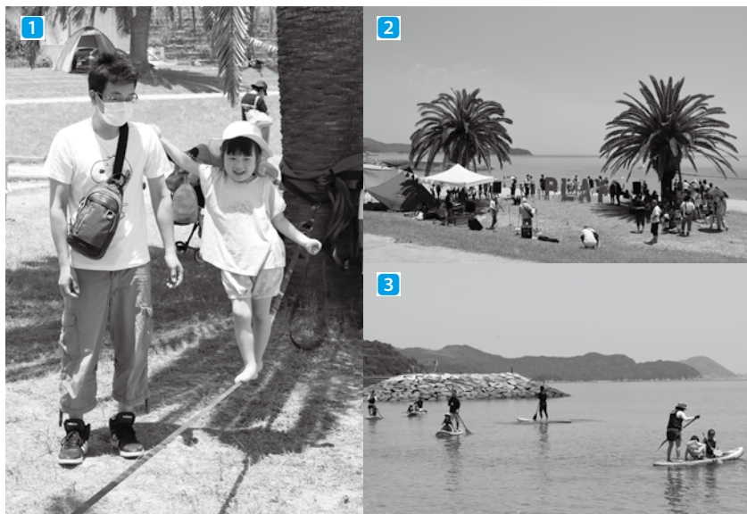
1 細いベルト状のライン上で、バランスを楽しむ遊び「スラックライン」に挑戦！ 2 ステージイベントの様子 3 サップ（スタンドアップ・パドルボード）体験