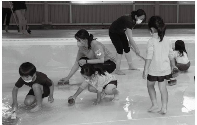
▲プール清掃の様子

また、プール清掃後には、B & G指導員による水辺の安全教室が行われ、水辺で活動するための注意点などを学びました。