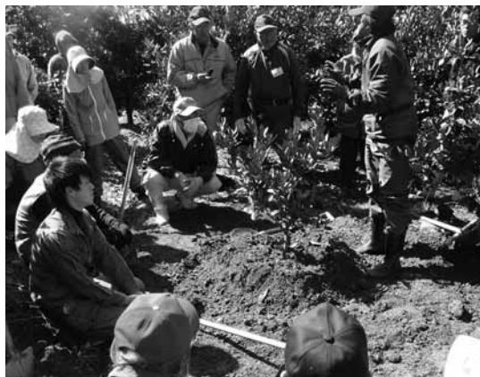
▲みかんいきいき営農塾（みかん植え付け講座）