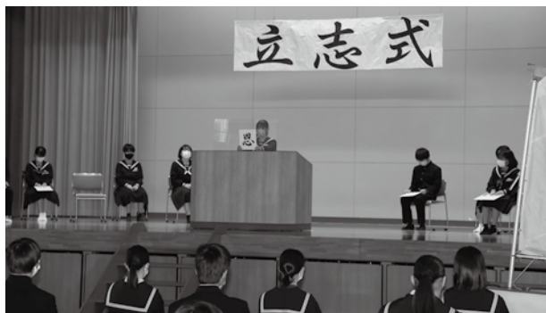
▲生徒一人一人が将来の決意と目標を表明。