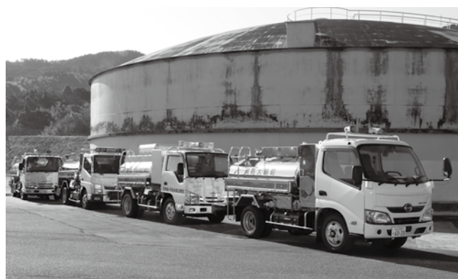
▲周防大島町や柳井市、田布施・平生水道企業団の給水車も集結

給水車は、災害や断水を伴う事故などによる非常時の応急給水活動の充実を図るために配備されたもので、周防大島町や近隣市町に配備された給水車も含め、緊急時や災害時での活躍が期待されます。