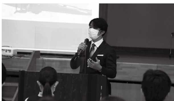
▲生徒たちにエールを送る小泉選手。