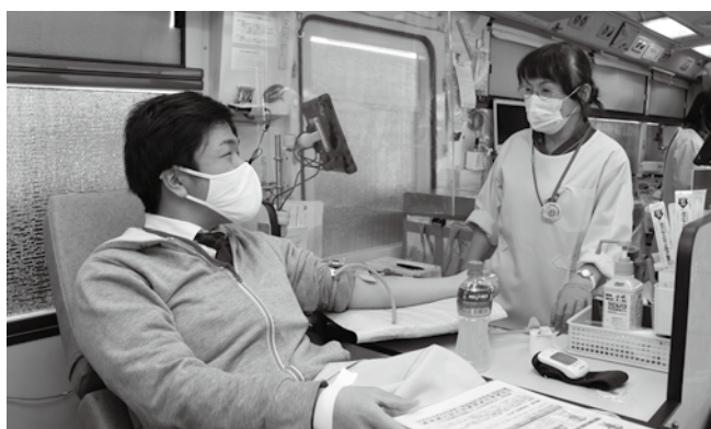
▲看護師さんと話しながら和やかな雰囲気での献血。

近年では、若年層の献血者が減少傾向にあり、輸血を必要としている方々を支えていくためには、各年齢層はもとより、若年層の協力がますます必要となります。皆さまのご協力をお願いします。