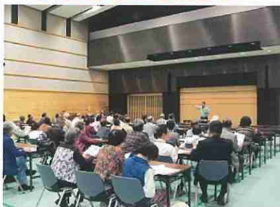
周防大島町身体障害者福祉協議会の皆さん