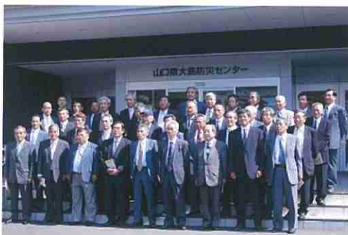
高松市消防団幹部先進都市視察研修の皆さん