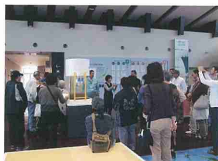
防府市社会福祉協議会の皆さん